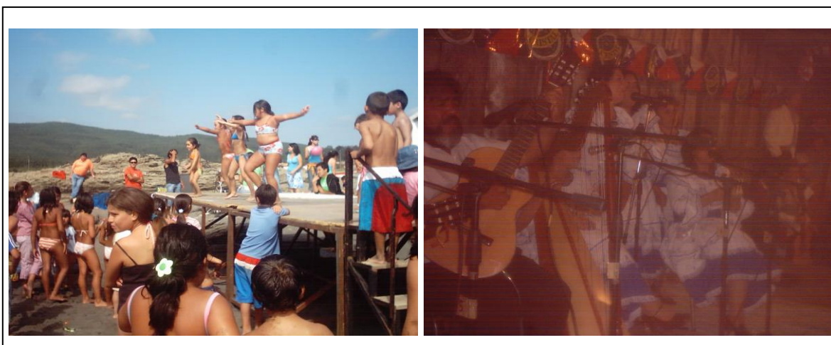
Foto 3. Celebración Semana Bucalemina

Otra actividad de carácter turístico y que es financiada por el municipio es la celebración de la Semana Bucalemina, la que se coordinó en conjunto con la Cámara de Turismo del balneario.