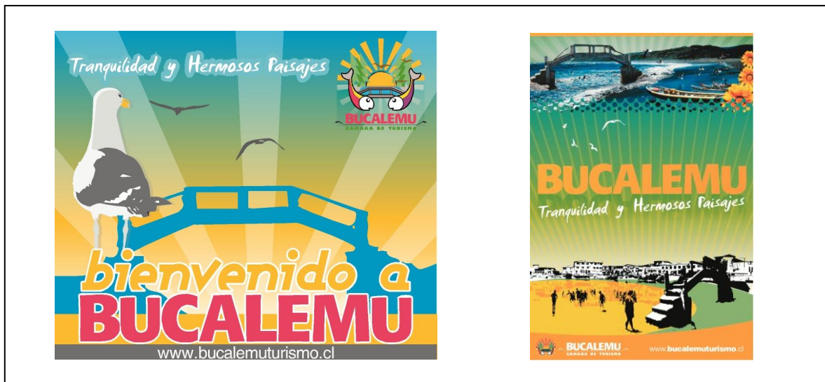
Foto 2. Afiches Cámara de Turismo de Bucalemu

Durante el año 2005 y con el apoyo del Servicio de Cooperación Técnica (SERCOTEC), se desarrolló el proyecto “Fortalecimiento de la Cámara de Turismo de Bucalemu”, por un monto de $1.145.000 el que consistió principalmente en la preparación de un plan trienal de actividades y la activación de una campaña de promoción a través de la confección de un logo, página web y folletería.